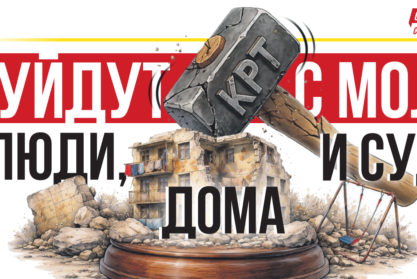
Иллюстрация: Елена Миронова

СПРАВЕДЛИВАЯ РОССИЯ выступает против превращения Самары в город «человечников»