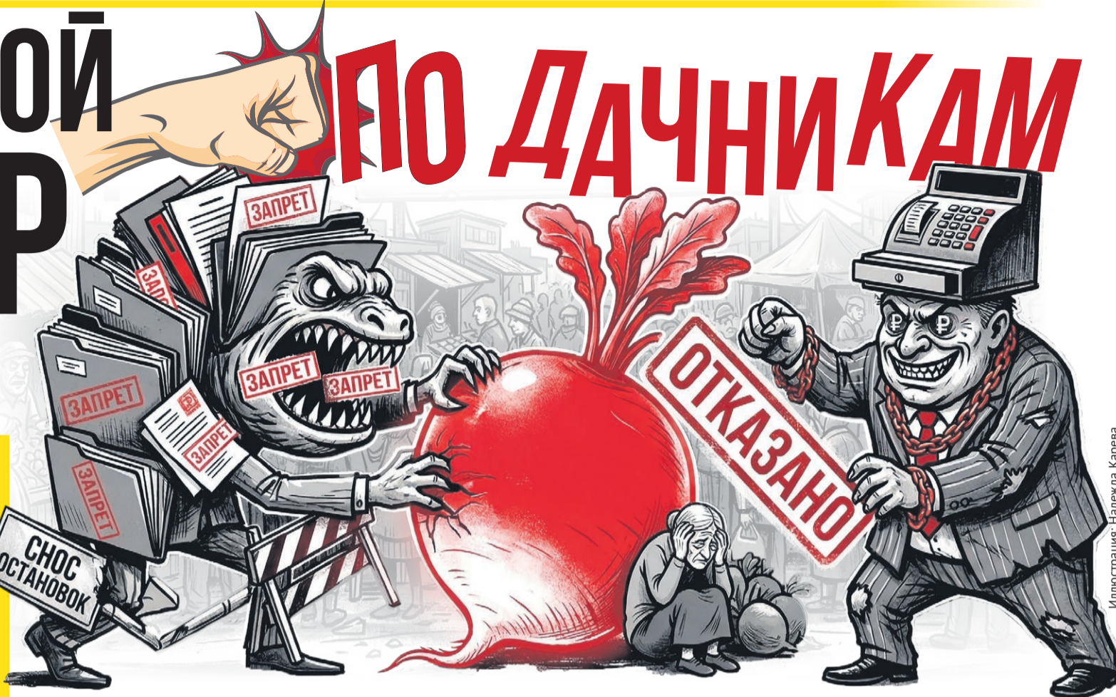
Иллюстрация: Надежда Карева

Пенсионер Николай В. из Тольятти уже посадил первую редиску и зелень в теплице, скоро будет собирать урожай. И он не против продать его, потому что для пожилого садовода это не только итог месяцев труда на грядке, но и надежда на прибавку к пенсии в пару тысяч рублей. Однако препятствия для дачника-предпринимателя начинаются еще по дороге на рынок. Ждать автобус в город приходится на клочке асфальта у шумной проезжей части своего садового товарищества вместе с десятками точно таких же дачников-пенсионеров. Нет навеса, где можно спрятаться от зноя. Зато есть знак – «ОСТАНОВКА ЗАПРЕЩЕНА».