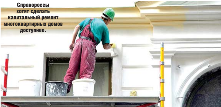
Справороссы хотят сделать капитальный ремонт многоквартирных домов доступнее.