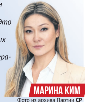
МАРИНА КИМ