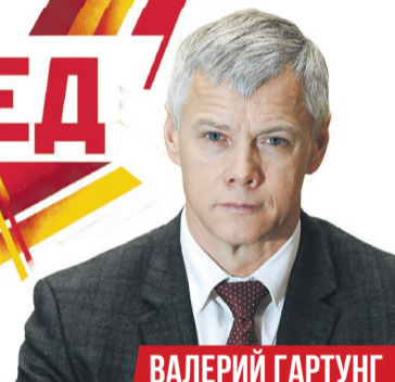
ВАЛЕРИЙ ГАРТУНГ