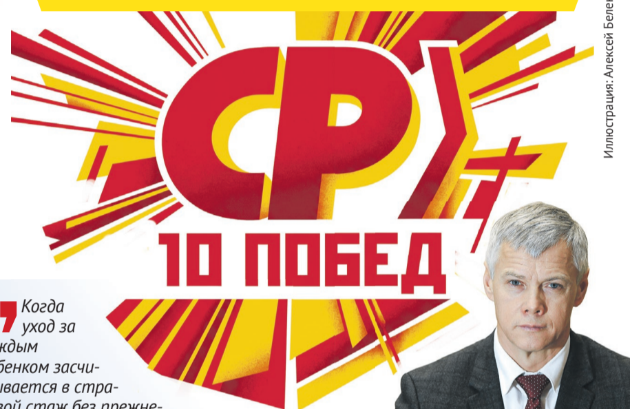
Иллюстрация: Алексей Беленёв

А вот для тех, кто получает более 500 миллионов рублей (включая дивиденды) в год, мы серьезно поднимаем ставку – до 35%. Важно, что законопроект предполагает освобождение от уплаты подоходного налога самых бедных – граждан, чей доход не превышает 12 прожиточных минимумов в год».