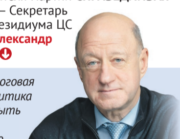
АЛЕКСАНДР БАБАКОВ